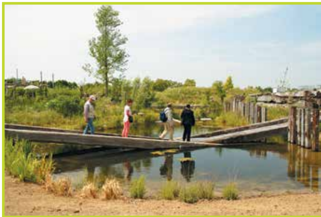
Hergebruik van dukdalven voor een brug over de vijver

Omdat het eerste seizoen van 2013 niet haalbaar bleek om al met uitvoering van het definitieve plan te starten werd besloten om een