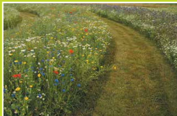
Met de tijdelijke spiraalakker in het eerste jaar was de toon gezet.

tijdelijke invulling aan het terrein te geven. Als reactie op de intensieve landbouw die achter het terrein plaatsvindt hebben we een plan gemaakt om positieve energie toe te voegen. Drie spiraalvormige banen die ingezaaid werden met verschillende akkerbloemenmengsels van De Bolderik en De Cryudt-Hoeck. Binnen enkele maanden veranderde het grasveld in een bloemenzee. De toon was gezet!