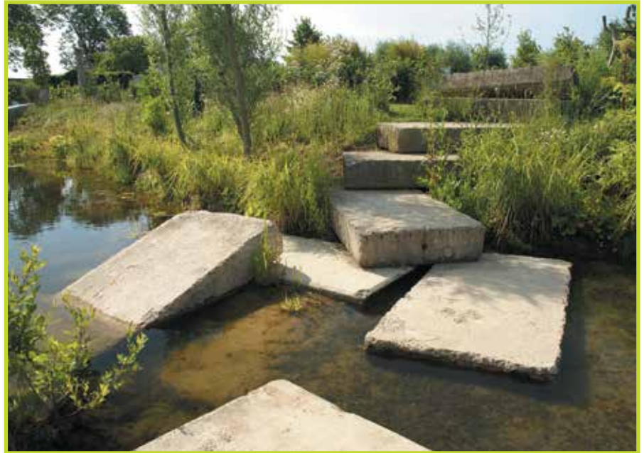
Dankzij de grote stapstenen kun je ook goed naar waterbeestjes kijken