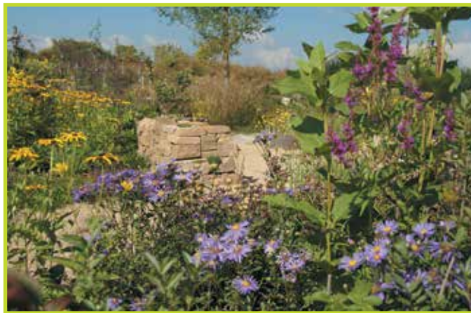
Dankzij de kleigrond ontwikkelt de tuin zich snel